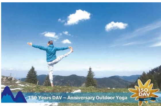
Foto: Outdoor Yoga Sessions

Anniversary Yoga: Am 1. Mai veranstaltete die International Mountaineering Group (IMG) die erste „Outdoor Yoga Session“ des Sommers in wunderschöner Bergkulisse.