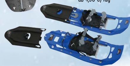
z. B. Schneeschuhe ab 4,50 €/Tag