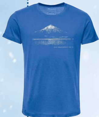
Merino-T-Shirts (verschiedene Modelle) ab 80,00 €