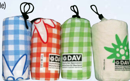
Hüttenschlafsäcke (aus Baumwolle oder Seide) ab 16,95 €