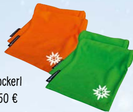
Gipfelsockerl ab 32,50 €