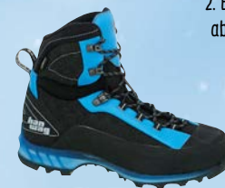
z. B. Bergschuhe für Damen & Herren ab 5 €/Tag