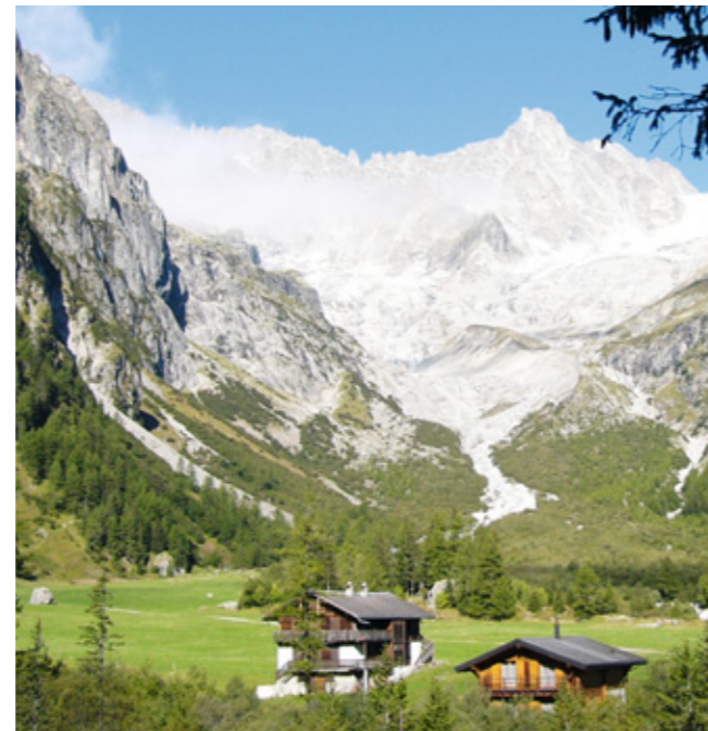
Das idyllische Val Ferret

vierten Tages in Ville des Glaciers auf 1800 m Höhe. Serpentine für Serpentine zieht der breite Weg in angenehmer Steigung dem Col de Seigne entgegen. Dabei wechselt allenthalben die Szenerie, Schneegipfel tauchen auf, und auf 2400 m schafft es auch die Morgensonne über die Gipfel. Am Pass bietet sich wieder mal ein fantastischer Rundumblick. Hinab geht es an einem kleinen Naturschutzhaus mit Ausstellung über die Mont-Blanc-Region vorbei zum Rifugio Elisabetta. Wir haben mit Italien das dritte der drei TMB-Länder erreicht. Die Küche öffnet erst um 12 Uhr – wir warten und genießen dann eine Polenta auf der Terrasse. Danach geht es zunächst auf gutem Wirtschaftsweg das Val Veni hinab bis zum Jardin du Miage. Hier beginnt eine Teerstraße und führt uns zur Cantine de la Visaille und zum Bus nach Courmayeur. Wir beziehen unser Zimmer im Hotel „Mont Blanc“ und genießen erst mal ein Eis in der beschaulichen Fußgängerzone. Die fünfte Etape führt uns durch den malerischen Ortsteil Villair und dann im Wald steil bergan zum Rifugio Bertone. Von dort schauen wir auf die Gletscher des Mont Blanc, hinab nach Courmayeur und hinüber zum Col de Seigne. Ich gehe den Höhenweg über La Leche gemütlich bis zum Rifugio Bonatti. Wolfgang