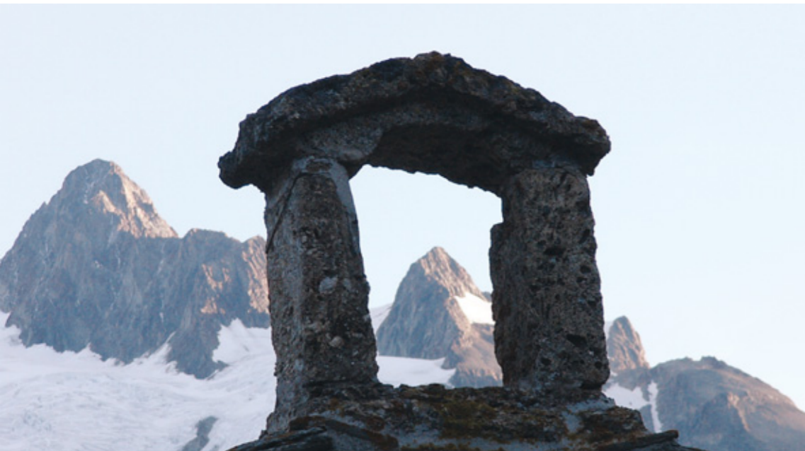
In Ville des Glaciers