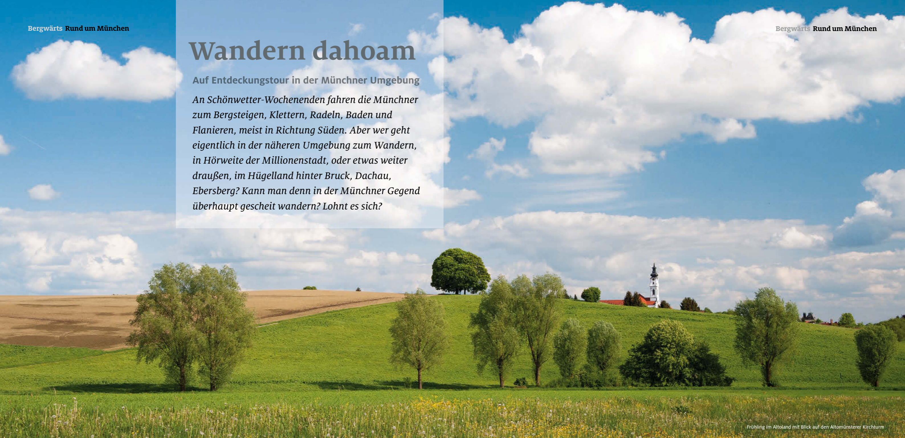
Frühling im Altoland mit Blick auf den Altomünsterer Kirchturm

An Schönwetter-Wochenenden fahren die Münchner zum Bergsteigen, Klettern, Radeln, Baden und Flanieren, meist in Richtung Süden. Aber wer geht eigentlich in der näheren Umgebung zum Wandern, in Hörweite der Millionenstadt, oder etwas weiter draußen, im Hügelland hinter Bruck, Dachau, Ebersberg? Kann man denn in der Münchner Gegend überhaupt gescheit wandern? Lohnt es sich?