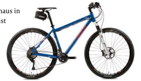
Das »vivax Previo« ist das mit nur 11,5 kg Gewicht angeblich leichteste E-MTB der Welt (Stand: April 2018) und äußerlich quasi nicht mehr von einem herkömmlichen Rad zu unterscheiden.