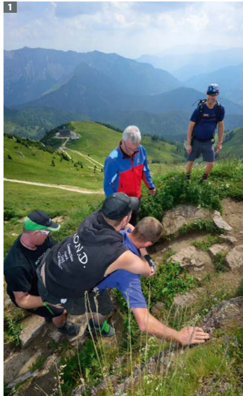
Die Schwierigkeit des Weiterwegs hat Aufforderungscharakter.

2 Spezielle Trekking-Rollis eignen sich besonders gut für Touren in den Bergen.