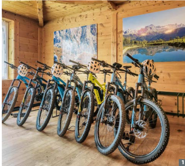
1 Immer mehr Urlaubsorte und Hotels stellen für ihre Gäste ganze Flotten von E-Mountainbikes bereit.