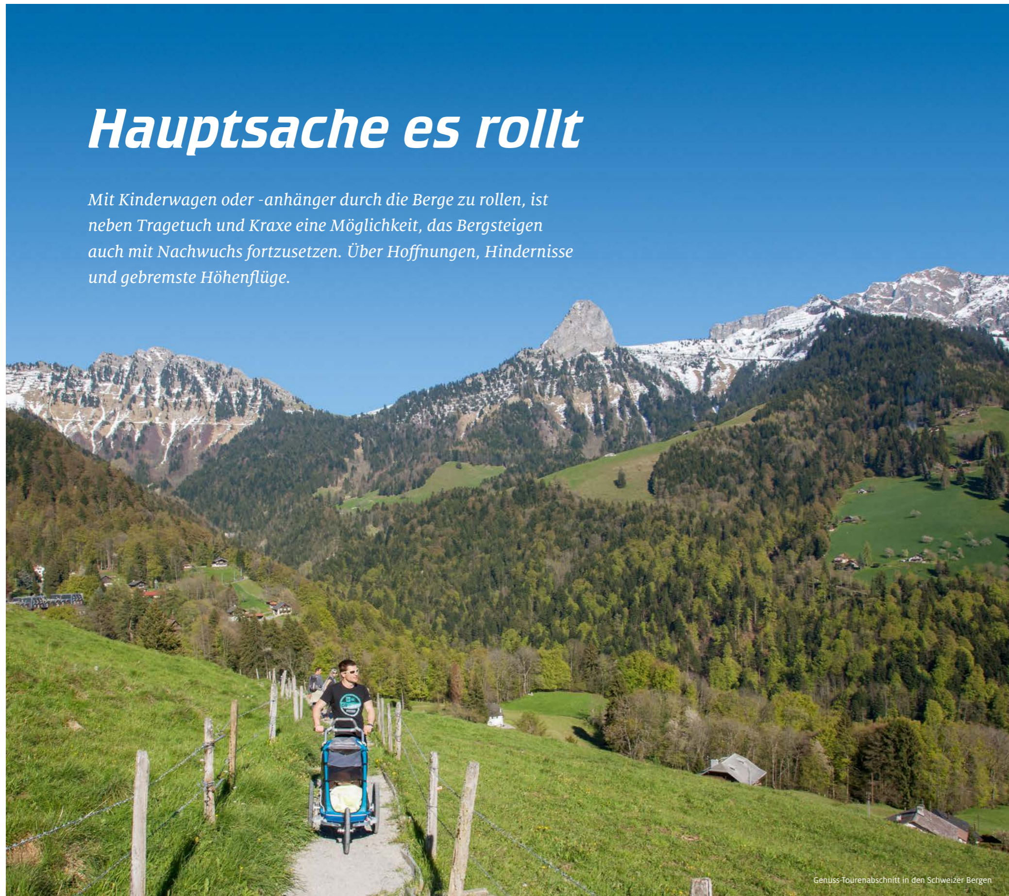
Genuss-Tourenabschnitt in den Schweizer Bergen

Mit Kinderwagen oder -anhänger durch die Berge zu rollen, ist neben Tragetuch und Kraxe eine Möglichkeit, das Bergsteigen auch mit Nachwuchs fortzusetzen. Über Hoffnungen, Hindernisse und gebremste Höhenflüge.