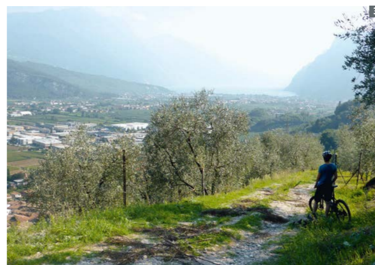
3 Kurz vor der Zieleinfahrt (hier nach Riva): der wohl schönste Moment einer Transalp