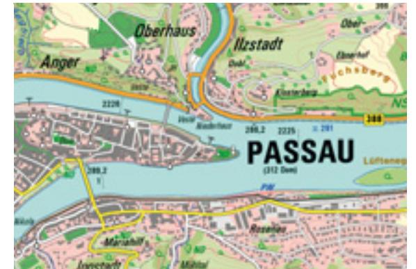
Der Zusammenfluss von Donau, Ilz und Inn in Passau. Der helle Inn dominiert farblich, weil er viel seichter als die Donau ist und diese förmlich „überspült“.