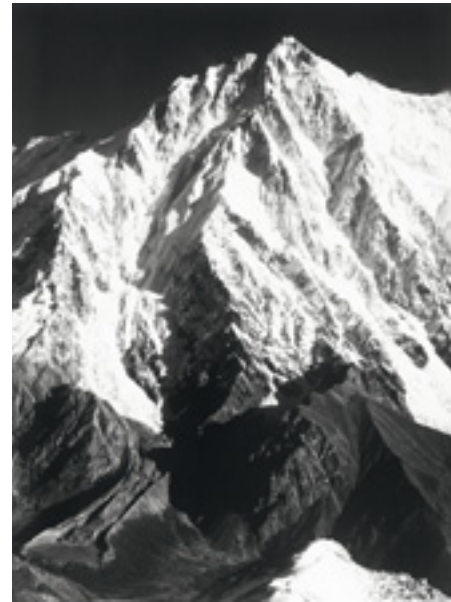
Die Rupalflanke des Nanga Parbat