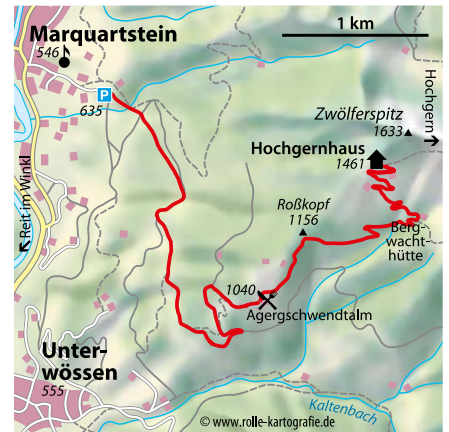
© alpinwelt 1/2021, Text: Klara Palme; Foto: Georg Pollinger

erste Mal links, das zweite Mal rechts. So erreicht man die schön gelegene Agergswendalm (1040 m). Der Weg führt links am Almgebäude vorbei zum nahen Waldrand. Nun folgt ein langer Aufstieg durch den Wald, an einer unbeschilderten Abzweigung hält man sich geradeaus. Im letzten Teilstück leitet der Weg in Serpentinauf zum Bergwachthütte (ca. 1300 m) und zum freien Almgelände. Nach einigen Minuten ist das Hochgernhaus (1461 m) erreicht. Der Abstieg hält sich an den Aufstiegsweg. Charakter: Die Wanderung zum Hochgernhaus ist für den Winter sehr gut geeignet. Sie ist einfach (nur der Gipfelanstieg ist etwas schwieriger), häufig gespurt, eignet sich bei den richtigen Verhältnissen auch als Rodelbahn und man kann sich im Hochgernhaus stärken!