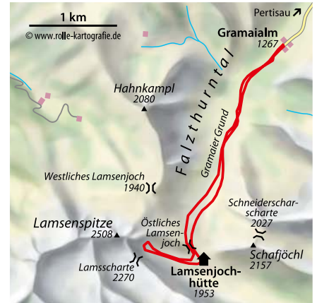
© alpinwelt 1/2021, Text: Klara Palme; Foto: Georg Pollinger

tens an der rechten äußeren Ecke, am Einstieg zur Nord-Ost-Kante, zu beenden. Die Abfahrt erfolgt entlang der Aufstiegsspur, zunächst den traumhaften Osthang ins Lamsenjoch herunter und weiter in die Rinne, wobei die mittigen Felsblöcke je nach Schneelage links oder rechts umfahren werden.