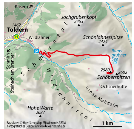
© alpinwelt 1/2021, Text und Foto: Michael Prötzel

scharf nach rechts, um den Gipfel zu erreichen. Die Abfahrt erfolgt auf dem Anstiegsweg oder über folgende Möglichkeiten: Variante A: Vom Ski-depot nur ein Stück ab und nach links in die großartigen Nordwesthänge unterhalb der Schöberspitzen queren. Im Wald ist guter Orientierungssinn gefragt, um durch die zugewachsenen Passagen zu kommen und den Talboden zu erreichen, über den es zum Ausgangspunkt geht. Variante B: Vom Ski-depot nach Südwesten zur Ochsnerhütte. Dort direkt nach Süden, um die großen Steilstufen an der Großen Mahdalm zu umfahren. Schließlich wieder nach Westen zum Talboden. Wenn keine Spur vorhanden ist, sollte man diese Variante nur bei guter Sicht und sehr gutem Orientierungsvermögen unternehmen.